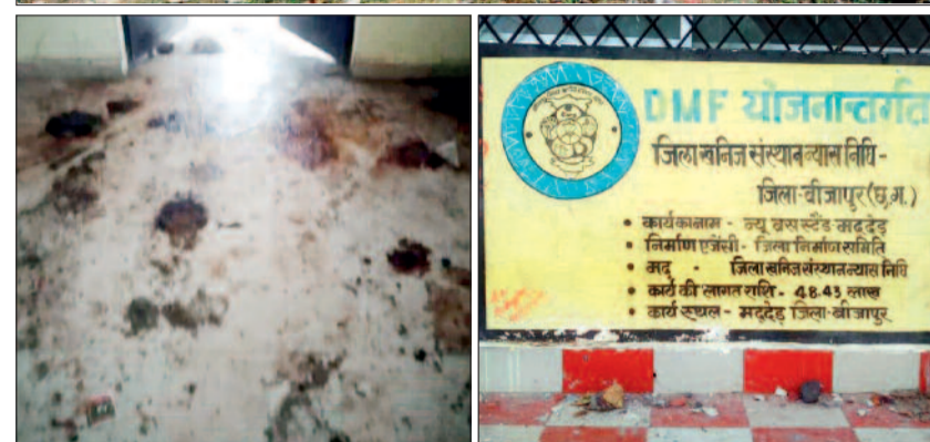
मद्देड़ बस स्टैंड का खंडहर, जो 50 लाख रुपये से अधिक की लागत से तैयार हुआ था, लेकिन उद्घाटन नहीं हुआ और बसें वहीं रुकती हैं।